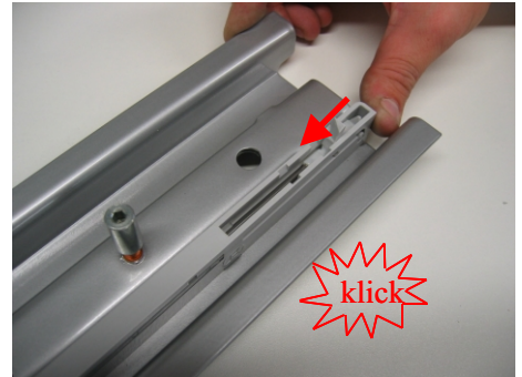
Einrasten lock in place

Unter seitlichem Druck nach vorne schieben, hinterer Rasthaken fädelt ein move it forward by putting pressure on the side until hook pin at back fits into opening