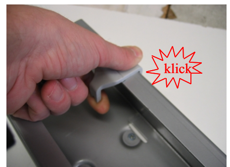
Einrasten lock in place