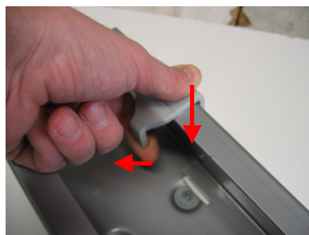
Nach unten drücken press it downwards