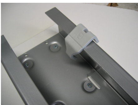
Aufsetzen put in position